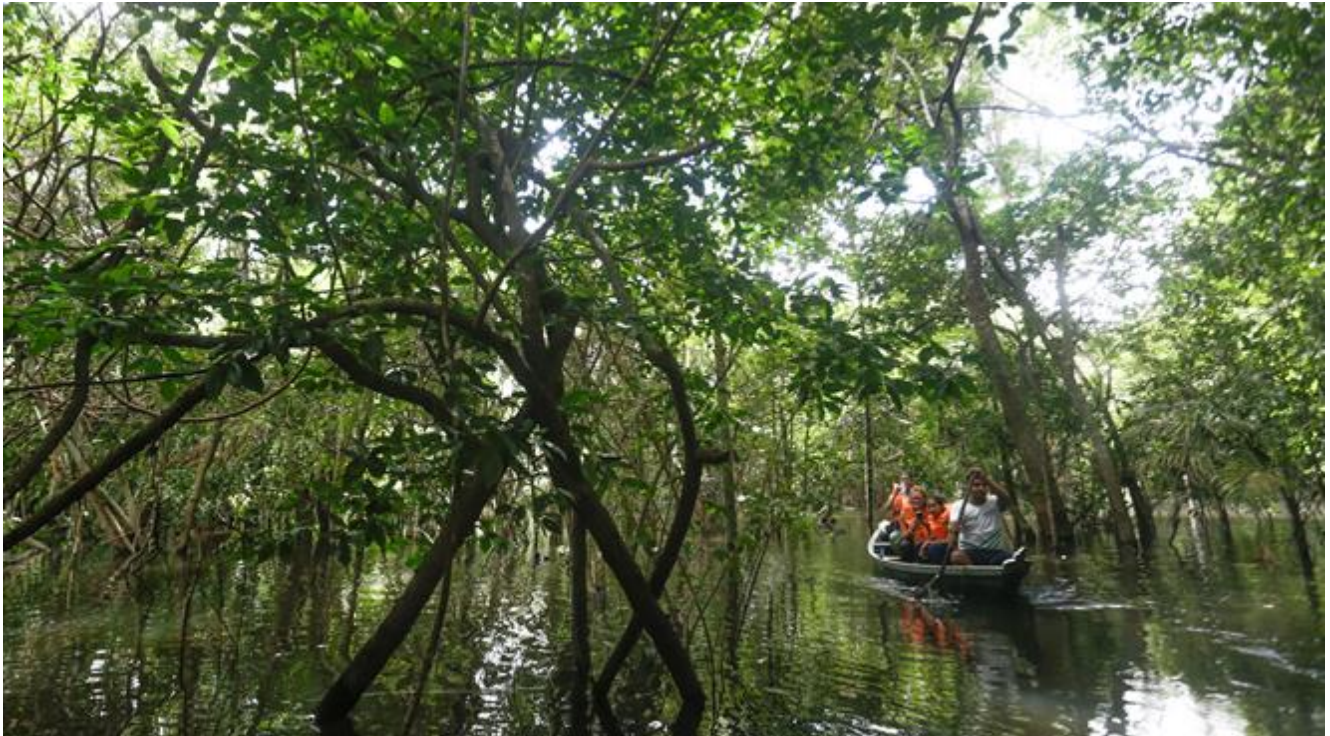
Canoagem pelos igapós.

Amanheceremos no Canal do Jari, dormitório dos pássaros da região e um estreito braço do Rio Amazonas. O canal é ideal para observarmos, bem cedo, alguns animais, como jacarés, iguanas e papagaios, navegando pelos igapós e florestas inundadas.