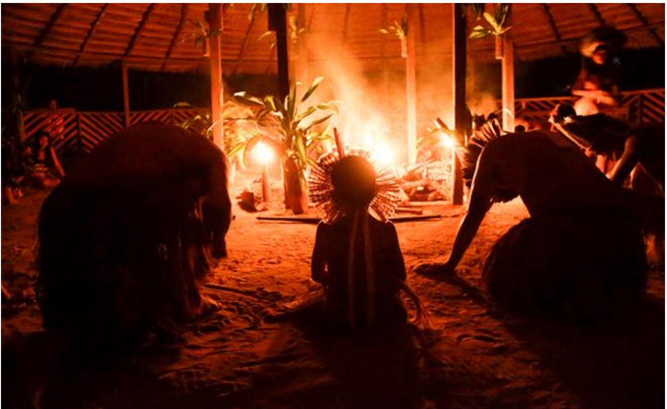
Ritual indígena Munduruku.

Hoje o dia é dedicado a uma vivência com os Munduruku, povo indígena que se estabeleceu no vale do Rio Tapajós desde o final do século XVIII. Famosos pela tradição guerreira, eles vivem resistindo nesta região até hoje. Através de uma roda de histórias, oficina de arco e flecha, pintura corporal e participação em um dos seus rituais tradicionais, poderemos conhecer um pouco mais da realidade dos povos indígenas na atualidade e de sua atuação como guardiões da floresta.